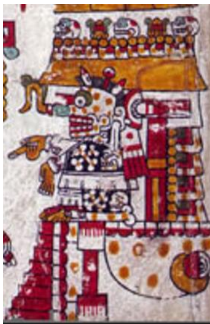
Figura 3. Códice Zouche-Nuttall: Pág. 49 (reverso).

El tercer componente que se encuentra en la página tiene más elementos y detalles. Se trata de la combinación de un glifo toponímico y una persona que se postra sobre el mismo. Con respecto al glifo, se tiene como signo base la de templo, pero los elementos presentes dan a entender que se trata de un lugar en específico.