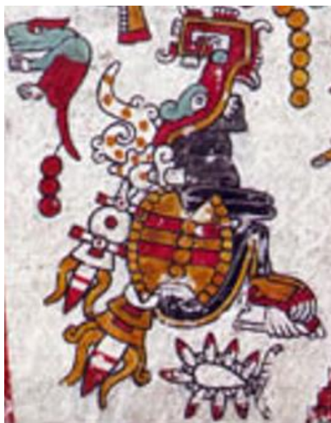
Figura 4. Códice Zouche-Nuttall: Pág. 49 (reverso).

En este apartado de la página se muestran dos glifos que corresponden a la fecha de la escena mostrada: año 6 Caña, día 6 Serpiente. Justo debajo de los dos glifos se encuentra un ser humano masculino, por lo que se activa el modo icónico al representar la idea de un ser humano masculino real; en el glifo se puede observar a la izquierda del ser humano el nombre de esta persona, que es 3 Lagartija.