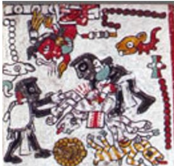
Figura 11. Códice Zouche-Nuttall: Pág. 49 (reverso).

El último componente de esta página del códice consiste en una escena que protagoniza a tres personajes: el Señor 8 Venado y el Señor 12 Movimiento en la parte inferior, y en la parte superior se encuentra el Señor 13 Caña. En la escena se pueden apreciar los tres glifos de nombre de todos los personajes involucrados. Además, se encuentran los nombres poéticos de los dos personajes que aparecen con la piel negra que, de derecha a izquierda, son Jaguar Sangriento y Garra de Jaguar, de acuerdo con Anders et al. (1992). Entre ellos se encuentran dos animales que son parte de un ritual de sacrificio: un perro y un venado que el Señor 8 Venado y el Señor 12 Movimiento asesinan con armas afiladas que parecen ser cuchillos.