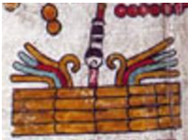
Figura 2. Códice Zouche-Nuttall: Pág. 49 (reverso).

En segundo lugar, se tiene el glifo toponímico que se presenta en la página del códice. El glifo contiene tres elementos de semiosis. En términos generales, las partes que lo componen son el valle o llano como signo base, que es el rectángulo color dorado formado por rectángulos más pequeños. Después, se tienen volutas de colores arriba de la base del topónimo, a ambos lados; estas volutas se asemejan a los dibujos de fuego que se presentan a lo largo del códice. Sin embargo, los colores difieren de las representaciones que se le dan al fuego, las cuales suelen tener colores rojizos y amarillos; por su parte, estas volutas tienen colores llamativos, por lo se tratan más bien de un conjunto de plumas.