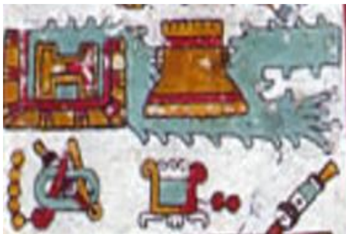
Figura 10. Códice Zouche-Nuttall: Pág. 49 (reverso).