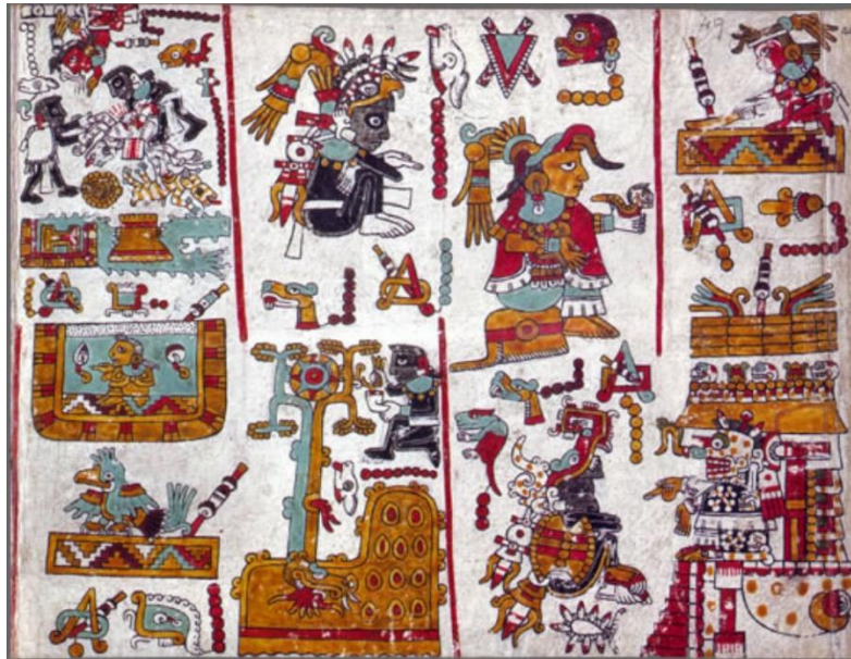
Figura 0. Códice Zouche-Nuttall: página 49 reverso.

(1992a) en el contexto de los 500 años de la lucha de los pueblos originarios del continente americano ante la conquista de los europeos. El Códice Zouche-Nuttall, en las páginas del reverso, cuenta la biografía del líder mixteco 8 Venado Garra de Jaguar, quien vivió en el territorio histórico de Oaxaca entre el final del siglo XI e inicio del XII, convirtiéndose en una leyenda debido al éxito como guerrero, sacerdote y cacique, que lo llevó a unificar a la Mixteca Baja, la Mixteca Alta y la Mixteca de la Costa. La página 49 reverso se muestra en escritura pictográfica en la Figura 0.