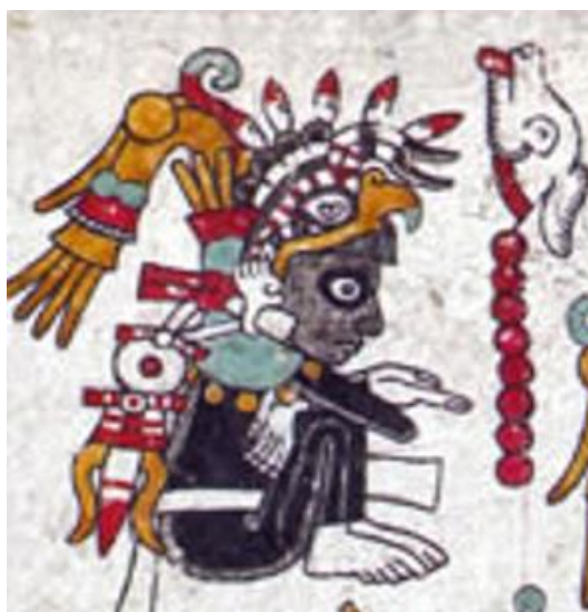
Figura 6. Códice Zouche-Nuttall: Pág. 49 (reverso).

En este apartado de la página del códice Zouche Nuttall se muestra a un ser humano masculino, por lo que se activa el modo icónico debido a que representa a un ser humano real. Esta persona presenta, al lado derecho, su nombre calendárico a través de dos glifos: 8 Venado.