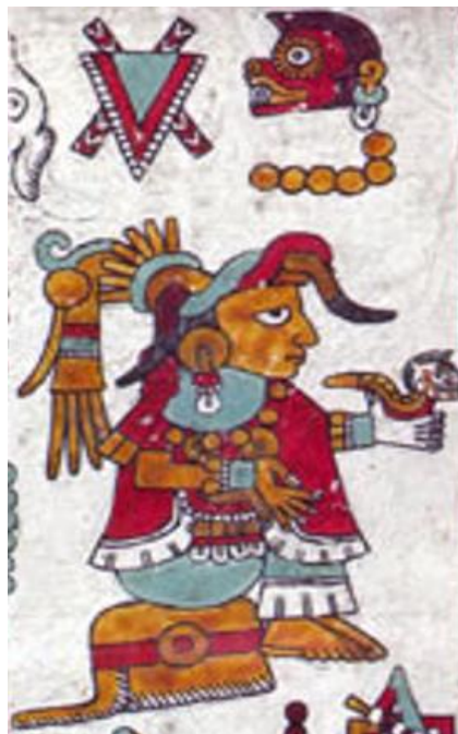
Figura 5. Códice Zouche-Nuttall: Pág. 49 (reverso).

Este pictograma es la representación de un ser humano femenino, por lo que activa el modo icono ya que es una imagen que representa la realidad. Al mismo tiempo, este pictograma también activa el modo de índice porque es parte de una escena más grande y representa acción de una persona importante de la nobleza, esto porque está sentada en un cojín de piel de jaguar que es considerado el asiento de la realeza; asimismo, se activa el modo de símbolo ya que transmite el sentido de que no solo es un ser humano femenino sino alguien de gran estatus en la comunidad mixteca.