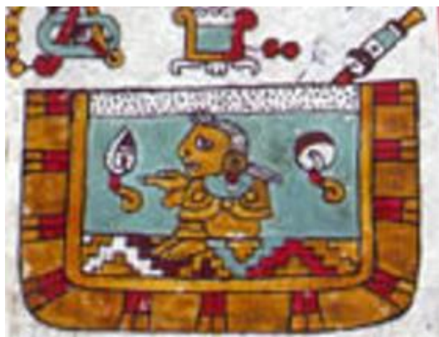
Figura 9. Códice Zouche-Nuttall: Pág. 49 (reverso).

En cuanto al pictograma del quinto topónimo se logra apreciar el glifo de río llamado Río de Ceniza, conocido como el lugar de la Abuela, representado como ícono, ya que su visualización no es alejada de la realidad del objeto en el punto de vista semiótico.