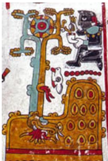
Figura 7. Códice Zouche-Nuttall: Pág. 49 (reverso).

En el tercer topónimo presentado se muestran los glifos de la fecha del día 6 Serpiente del año 6 Caña, donde se puede apreciar un ser humano masculino como ícono llamado 8 Venado, quien como sacerdote realiza la actividad de rendir culto al Árbol del Sol y al Árbol del Oriente, que funcionan como índices debido a que representan características de la realidad de una manera simbólica.