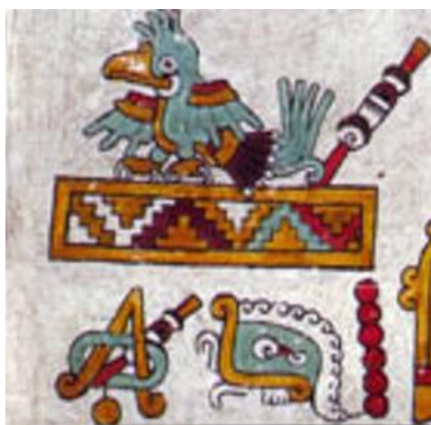
Figura 8. Códice Zouche-Nuttall: Pág. 49 (reverso).

A un costado del año se encuentra el glifo de día. Este es identificado de acuerdo con el pictograma que en los códices se ubica cerca del glifo de año y es una representación de algún día del calendario mixteco. Este representa el agua, pues se identifica el color azul como si estuviera dentro de algo, además cuenta con los detalles de unas “olas” en la parte superior, lo que simula el movimiento del agua. En caso de no contar con la imagen a color, gracias a estas distintivas “olas” formadas es que se puede intuir que se trata del glifo calendárico de agua. Junto a esta representación, se encuentra de igual manera que en el caso de año, una serie de seis círculos unidos con una línea delgada, con lo que indican el número del día.