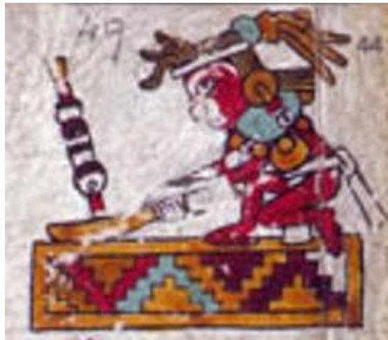
Figura 1. Códice Zouche-Nuttall: Pág. 49 (reverso). Recuperado de https://pueblosoriginarios.com/meso/oaxaca/mixteca/zouche-nuttall.html

En primer lugar, tenemos un topónimo (el cual indica lugar), conformado por tres elementos de semiosis. El primero, la base rectangular con pirámides de colores que es el signo base y representa a un pueblo o espacio de tierra; el segundo es una persona de género masculino pintado de color rojo con una especie de coa; y el tercero una flecha clavada en la plataforma rectangular que representa que este lugar fue conquistado. Este lugar representado por un topónimo se refiere a la Ciudad de la Coa, la cual fue conquistada por 8 Venado, Garra de Jaguar al participar en una expedición de guerra cuando era joven.